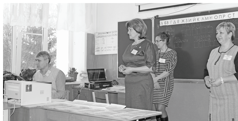
Задания были получены с Интернет-ресурса в режиме реального времени.

ла всем успеха и дальнейшие 40 минут мы старательно извлекали из памяти все свои знания в области родного языка. Заданий у нас было меньше, чем у детей, всего 14 вопросов и сочинение. Но и времени гораздо меньше — 40 минут.