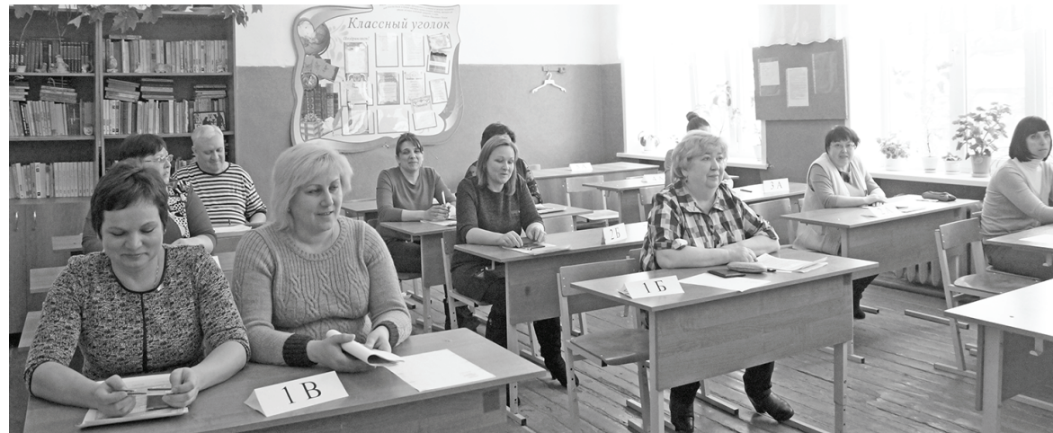
После экзамена все собрались в одной аудитории. Разговор о ЕГЭ шел подробный и конкретный.

3 марта в Думиничской средней школе №1 родители выпускников школ нашего района сдавали Единый государственный экзамен по русскому языку.